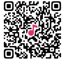
お試しワークショップ 応募フォーム

【申込方法】専用応募フォームよりお申込みください。(右側のQRコードからのアクセスが便利です) 「ソルミュ」ホームページから https://solmu2024ws.plazasol.net/