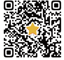
集中ワークショップ 応募フォーム (6/16開設)

【申込方法】専用応募フォームよりお申込みください。(右側のQRコードからのアクセスが便利です) 「ソルミュ」ホームページから https://solmu2024ws.plazasol.net/